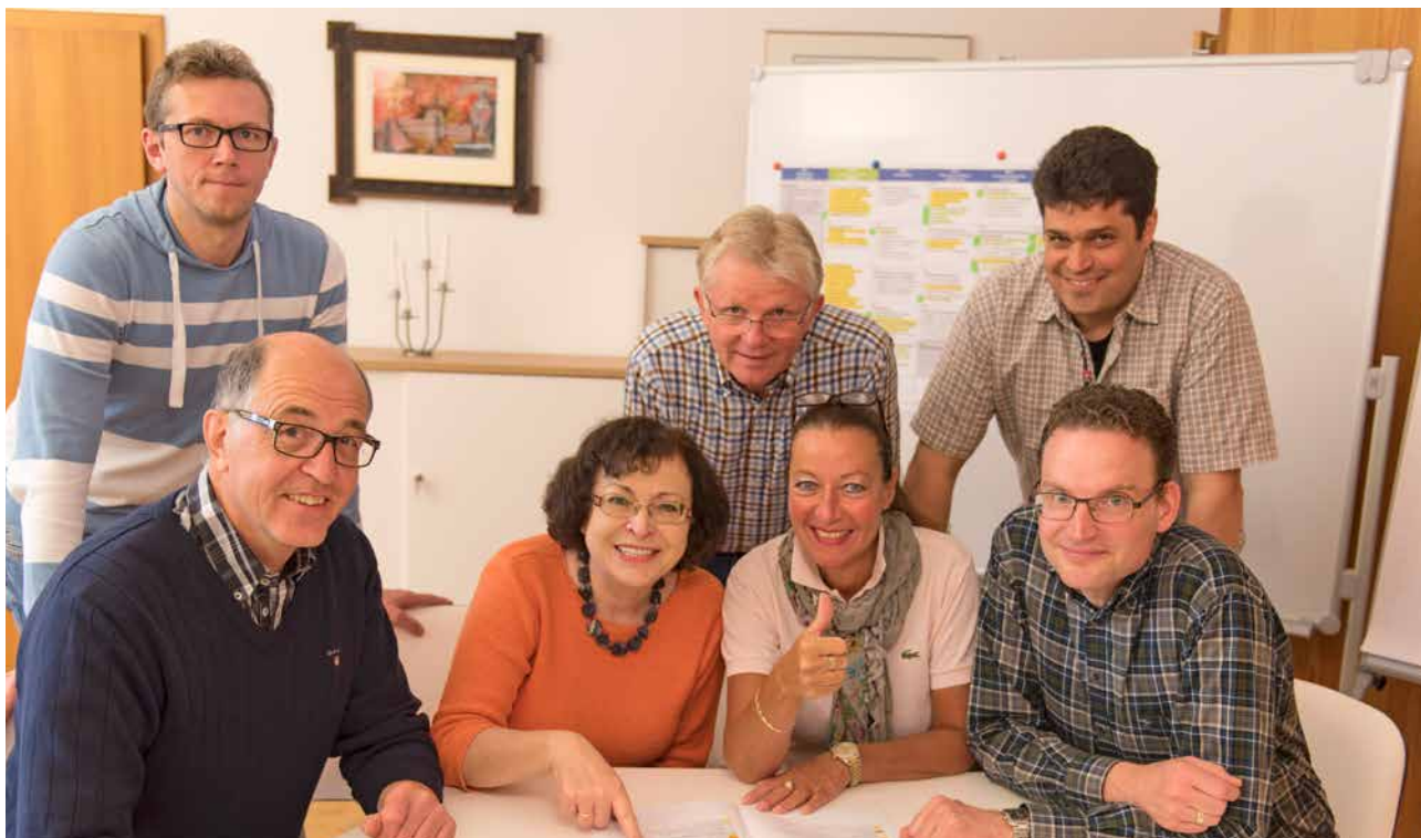
Die erweiterte Schulleitung freut sich über das gute Abschneiden der Qualitätsanalyse