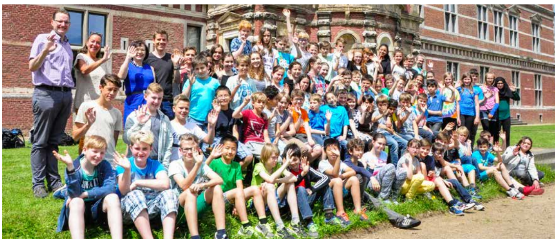
Teilnehmerinnen und Teilnehmer des diesjährigen Känguruwettbewerbs

Auch außerhalb der Preisträgerränge gab es bemerkenswert gute Wettbewerbsergebnisse. Alle Schülerinnen und Schüler erhielten für ihre Teilnahme eine Urkunde und ein interessantes Logikspiel als Anerkennung, was sehr viele unter ihnen motivieren dürfte, auch im nächsten Jahr wieder dabei zu sein.